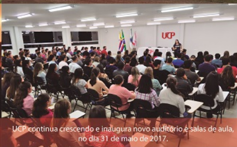
UCP continua crescendo e inaugura novo auditório e salas de aula, no dia 31 de maio de 2017.