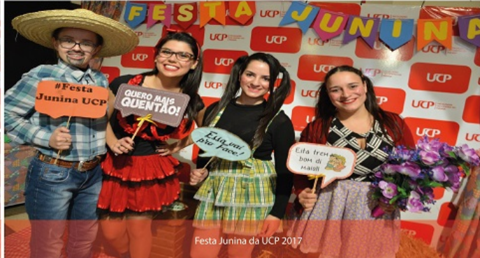
Festa Junina da UCP 2017