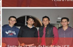
Festa de 15 anos da Faculdade UCP