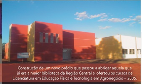
Construção de um novo prédio que passou a abrigar aquela que já era a maior biblioteca da Região Central e, ofertou os cursos de Licenciatura em Educação Física e Tecnologia em Agronegócio – 2005.