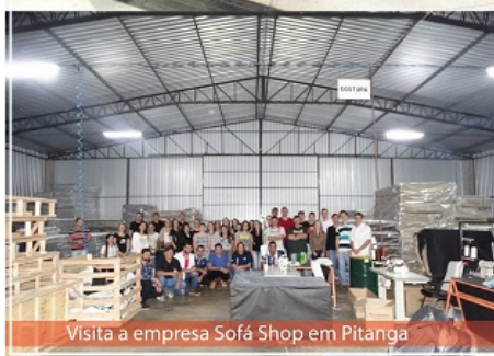
Visita a empresa Sofá Shop em Pitanga