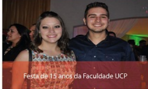
Festa de 15 anos da Faculdade UCP