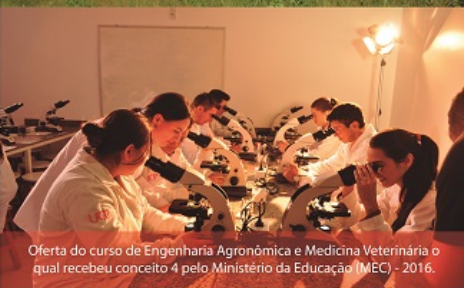
Oferta do curso de Engenharia Agrônoma e Medicina Veterinária o qual recebeu conceito 4 pelo Ministério da Educação (MEC) - 2016.