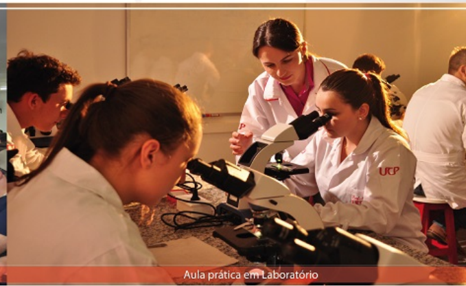
Aula prática em Laboratório

Os alunos do curso de Engenharia Agrônômica desenvolvem diversas atividades que aliam a teoria a prática, tais como cursos de extensão, aulas práticas de gênese e classificação de solos, coleta de insetos para coleções entomológicas, participam de palestras de vários temas, tais como: a relação entre pesquisa e a transferência de tecnologia aos produtores rurais, agricultura familiar, agroecologia, participam de workshop de empreendedorismo, participam do projeto UCP na Comunidade. Participaram do I Simpósio das Ciências Agrárias promovido pelos cursos de Agronegócio, Engenharia Agrônômica e Medicina Veterinária, no qual foram ministradas palestras sobre Empreendedorismo e Meio Ambiente, O Sucesso do Profissional de Ciências Agrárias e, foram realizados minicursos aplicados com os seguintes temas: Eficiência reprodutiva, Nutrição em Bovinocultura Leiteira, Enriquecimento ambiental e sua aplicação clínica para felinos domésticos; Projetos Agrícolas; Manejo de Nematoides na Agricultura e Empreendedorismo: Inovação na agricultura.