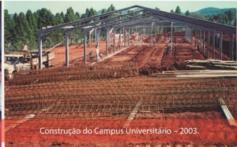
Construção do Campus Universitário – 2003.