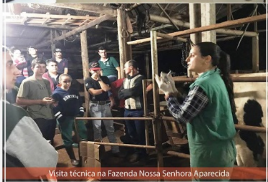
Visita técnica na Fazenda Nossa Senhora Aparecida

As aulas do Curso são marcadas por diversas atividades diferenciadas, dentre elas podemos destacar: aulas práticas, projetos de extensão, visitas técnicas e palestras, tais como: estudos com microrganismos e seus processos bioquímicos através da fabricação de alimentos que dependem de fermentação microbiana e outros agentes microbiológicos benéficos ao ser humano. Os acadêmicos também confeccionaram maquetes de células animais, vegetais e procaríotes, dos sistemas reprodutores masculino e feminino, dos sistemas digestório poligástricos e monogástricos, e também de osteologia. Os acadêmicos do curso realizaram uma visita técnica, na Fazenda Nossa Senhora Aparecida em Pitanga, aprenderam na prática a importância da sanidade para com os animais, bem como técnicas de diagnóstico das patologias Brucelose, Tuberculose e Zoonoses na Bovinocultura Leiteira. Foi realizado o I Simpósio das Ciências Agrárias que contou com a participação dos acadêmicos de Agronegócio, Engenharia Agrônômica e Medicina Veterinária, além dos convidados, com o tema central Empreendedorismo e Meio Ambiente, o Simpósio teve como objetivo diversificar o conhecimento teórico e, aplicá-lo nas diversas áreas de atuação dos profissionais das Ciências Agrárias.