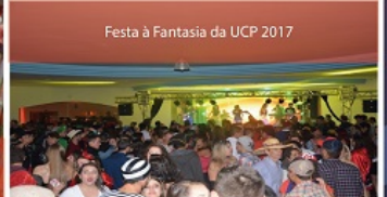
Festa à Fantasia da UCP 2017