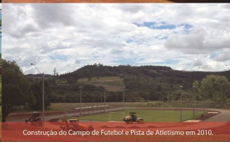
Construção do Campo de Futebol e Pista de Atletismo em 2010.