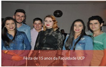
Festa de 15 anos da Faculdade UCP