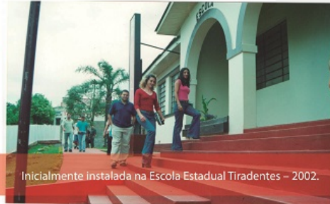
Inicialmente instalada na Escola Estadual Tiradentes – 2002.