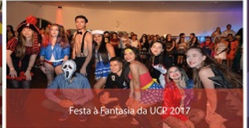
Festa à Fantasia da UCP 2017