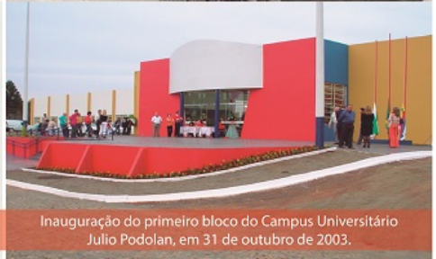
Inauguração do primeiro bloco do Campus Universitário Julio Podolan, em 31 de outubro de 2003.