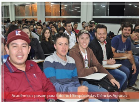
Acadêmicos posam para foto no I Simpósio das Ciências Agrárias

O Curso de Agronegócio realiza atividades de cunho acadêmico, científico e cultural com ênfase na realidade agrícola da região de abrangência dos acadêmicos da UCP. As atividades desenvolvidas pelo curso têm como objetivo inserir o aluno na realidade local, fazendo com que o mesmo elabore projetos e programas à serem implementados nas cadeias produtivas. Os acadêmicos participam de visitas técnicas em propriedades da região, de palestras sobre temas relevantes do agronegócio e, enriquecem suas práticas com atividades integradas, como por exemplo, no I Simpósio das Ciências Agrárias, promovido em conjunto com o curso de Engenharia Agrônoma e Medicina Veterinária.