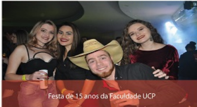
Festa de 15 anos da Faculdade UCP