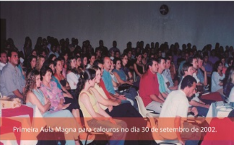
Primeira Aula Magna para calouros no dia 30 de setembro de 2002.