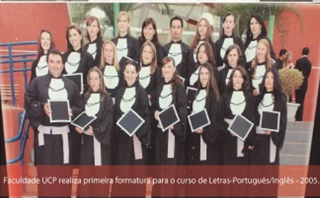
Faculdade UCP realiza primeira formatura para o curso de Letras-Português/Inglês - 2005.