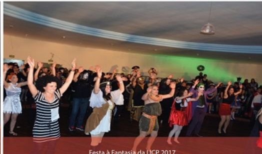
Festa à Fantasia da UCP 2017