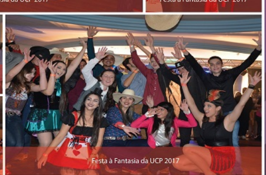
Festa à Fantasia da UCP 2017