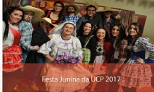
Festa Junina da UCP 2017