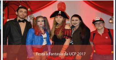
Festa à Fantasia da UCP 2017