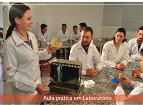
Aula prática em Laboratório