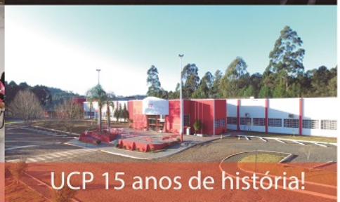
UCP 15 anos de história!