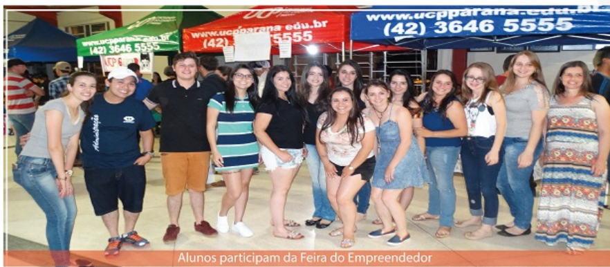
Alunos participam da Feira do Empreendedor