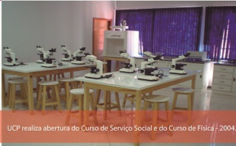
UCP realiza abertura do Curso de Serviço Social e do Curso de Física - 2004.