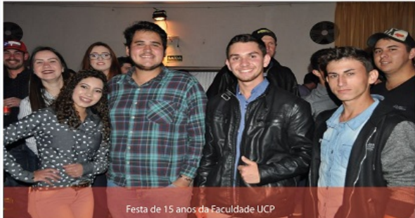
Festa de 15 anos da Faculdade UCP