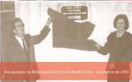
Inauguração da Biblioteca Dirce Doroti Merlin Cléve - novembro de 2003.