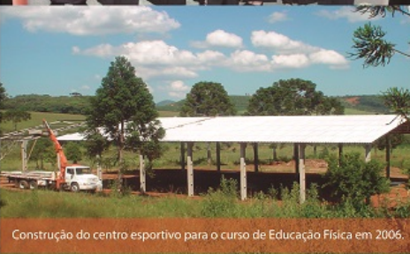
Construção do centro esportivo para o curso de Educação Física em 2006.