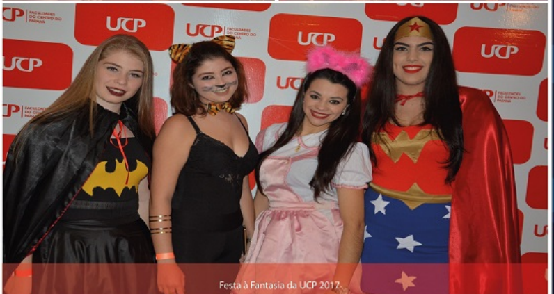
Festa à Fantasia da UCP 2017