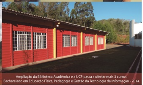
Ampliação da Biblioteca Acadêmica e a UCP passa a ofertar mais 3 cursos: Bacharelado em Educação Física, Pedagogia e Gestão da Tecnologia da Informação - 2014.