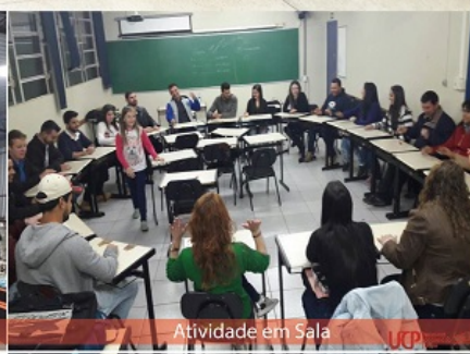
Atividade em Sala

No início de 2017 o curso de Administração da UCP obteve destaque, ficando como a 3ª melhor Faculdade do Curso de Administração entre as instituições particulares do estado do Paraná e, entre as 80 melhores do país. O resultado foi alcançado com base na avaliação de desempenho dos alunos - ENADE, corpo docente, infraestrutura, recursos didático-pedagógicos. O Curso de Administração da UCP tem como diferenciais: os professores que possuem experiência no mercado de trabalho, Empresa Júnior, atividades práticas, Feira de Empreendedorismo, parceria com SEBRAE (Projeto Educação Empreendedora), visitas técnicas e participação em eventos relacionados à área de atuação do profissional. Venha fazer parte da 3ª melhor instituição privada do Paraná.