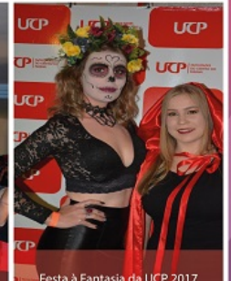
Festa à Fantasia da UCP 2017