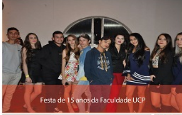
Festa de 15 anos da Faculdade UCP