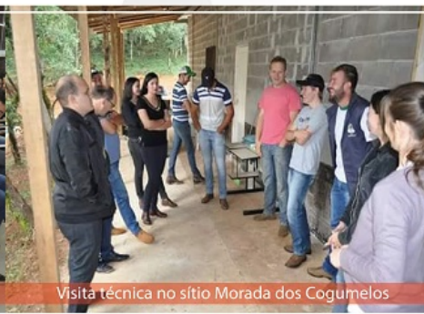
Visita técnica no sítio Morada dos Cogumelos