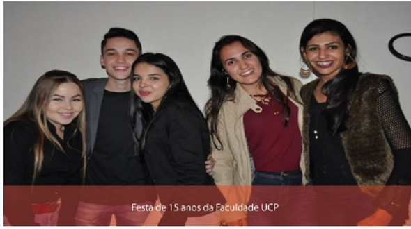
Festa de 15 anos da Faculdade UCP