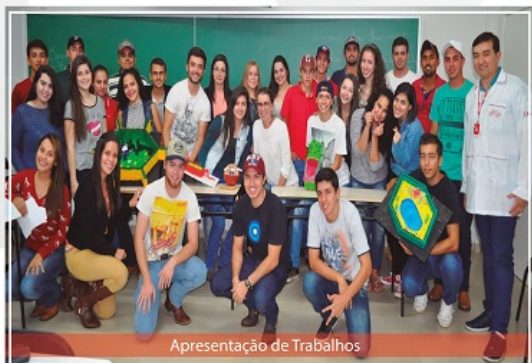
Apresentação de Trabalhos