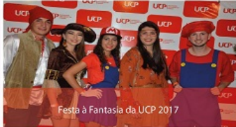
Festa à Fantasia da UCP 2017