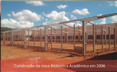
Construção da nova Biblioteca Acadêmica em 2006.