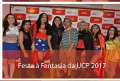
Festa à Fantasia da UCP 2017