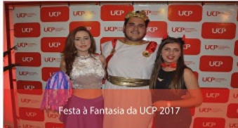
Festa à Fantasia da UCP 2017