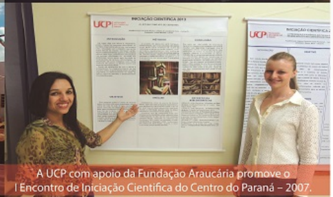
A UCP com apoio da Fundação Araucária promove o I Encontro de Iniciação Científica do Centro do Paraná – 2007.