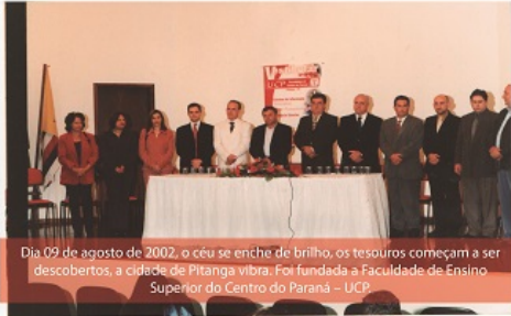
Dia 09 de agosto de 2002, o céu se enche de brilho, os tesouros começam a ser descobertos, a cidade de Pitanga vibra. Foi fundada a Faculdade de Ensino Superior do Centro do Paraná – UCP.