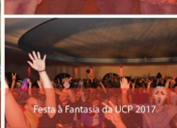
Festa à Fantasia da UCP 2017