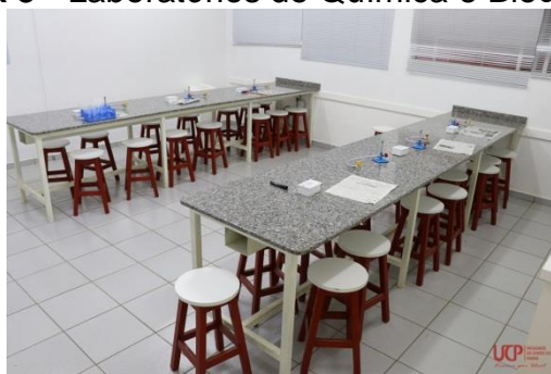
Figura 5 - Laboratórios de Química e Bioquímica.

O escopo do seu Sistema da Qualidade abrange a realização de aulas práticas laboratoriais com qualidade aplicando a Política, os Objetivos e os Procedimentos Operacionais Padrões – POP, elaborados de acordo com as BPLC. A fim de proporcionar aos alunos experiência prática laboratorial os tornando competitivos no mercados de trabalho.