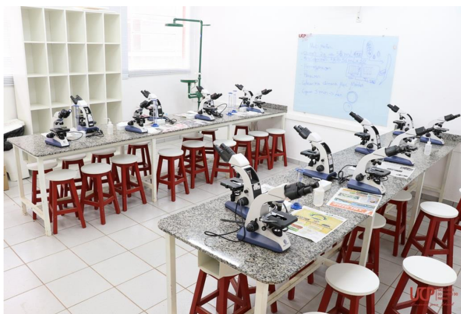
Figura 6 - Laboratório de Biologia Molecular.

Propicia estudar os princípios e teorias da Biologia Celular e Molecular, aprimorar seus conceitos, sua importância, compreender a Biologia para as ciências, seus estudos, seus avanços tecnológicos. Os acadêmicos aprendem, no decorrer do curso, práticas de laboratório de extrema importância.