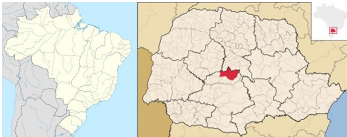
Figura 2 – Localização de Pitanga

O município de Pitanga está localizado na região central do estado do Paraná. Em um recorte regional, mais precisamente na mesorregião Centro-Sul, e na microrregião MRG28 (Figura 2).