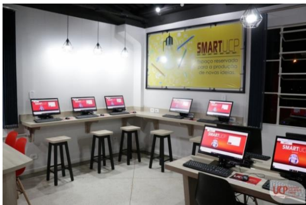
Figura 9 – Espaço SMART - Faculdade UCP

A sala também é um ambiente no qual os docentes podem planejar e postar suas atividades e sempre haverá um docente presente na sala para sanar as dúvidas e ajudar os acadêmicos.