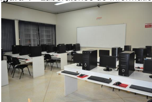
Figura 4 - Laboratórios de Informática.

e permitir práticas fundamentais. Atualmente são 2 laboratórios de informática, que devem ser utilizados, para atividades acadêmicas dos cursos e eventualmente para a comunidade externa que os utiliza para cursos de capacitação; todos com acesso livre à internet. Um dos laboratórios tem 30 máquinas e o outro 25 máquinas.