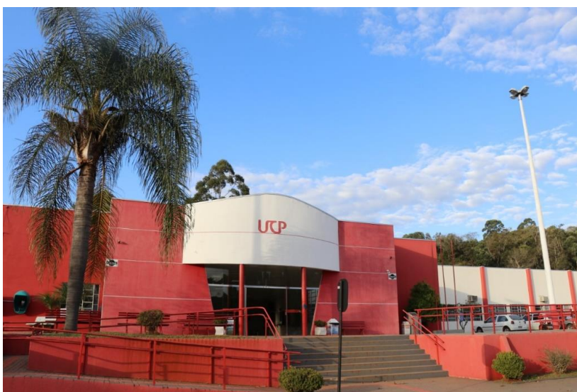
Figura 1 – Faculdade de Ensino Superior do Centro do Paraná

O Corpo dirigente, docente e técnico administrativo da Faculdade UCP concentra-se na busca permanente de qualidade no desempenho de suas funções, com vistas a propor um projeto político pedagógico de curso, que objetive qualidade na formação dos alunos e egressos e dos serviços prestados à sociedade.